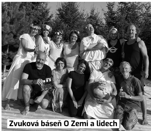
Zvuková báseň O Zemi a lidech