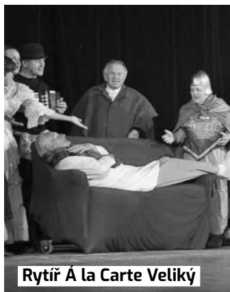
Rytíř Á la Carte Veliký