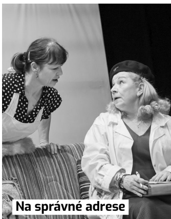
Na správné adrese